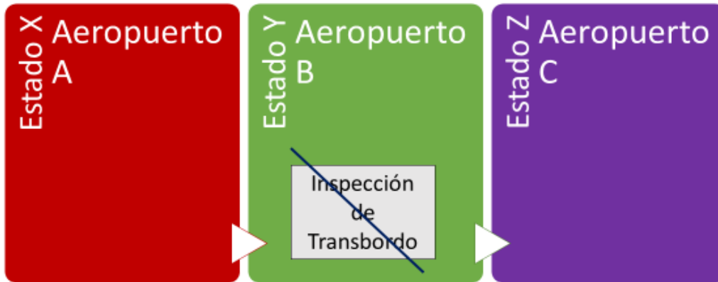
Figura 2 Reconocimiento de la disposición de Equivalencia

3.4.3 El Proceso de Verificación se basa en que los Estados involucrados cumplan con los requerimientos mínimos que establecen las Normas 2.4.2, 3.1.3, 4.4.2, 4.4.3 y 4.5.4 del ANEXO 17.